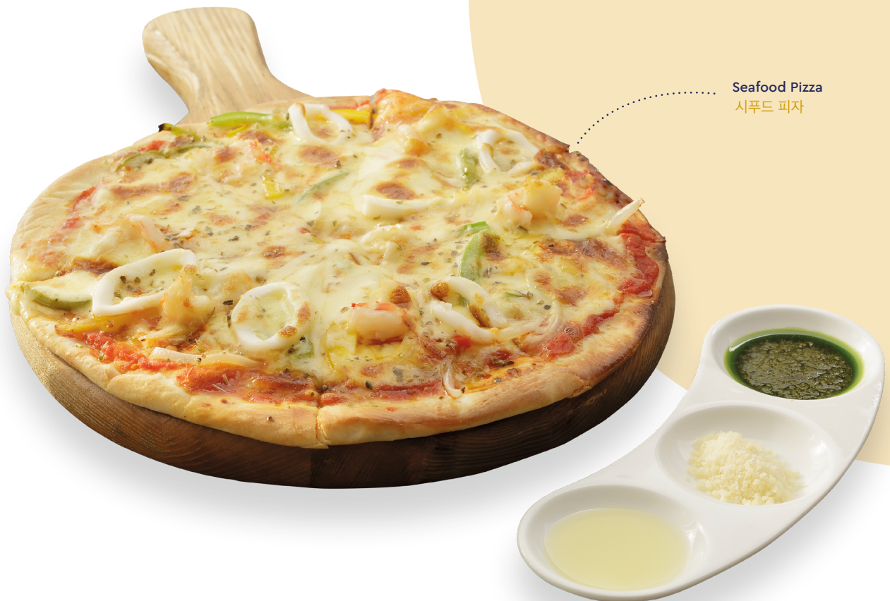
Seafood Pizza 시푸드 피자

All prices above are quoted in VND and included VAT & Service Charge